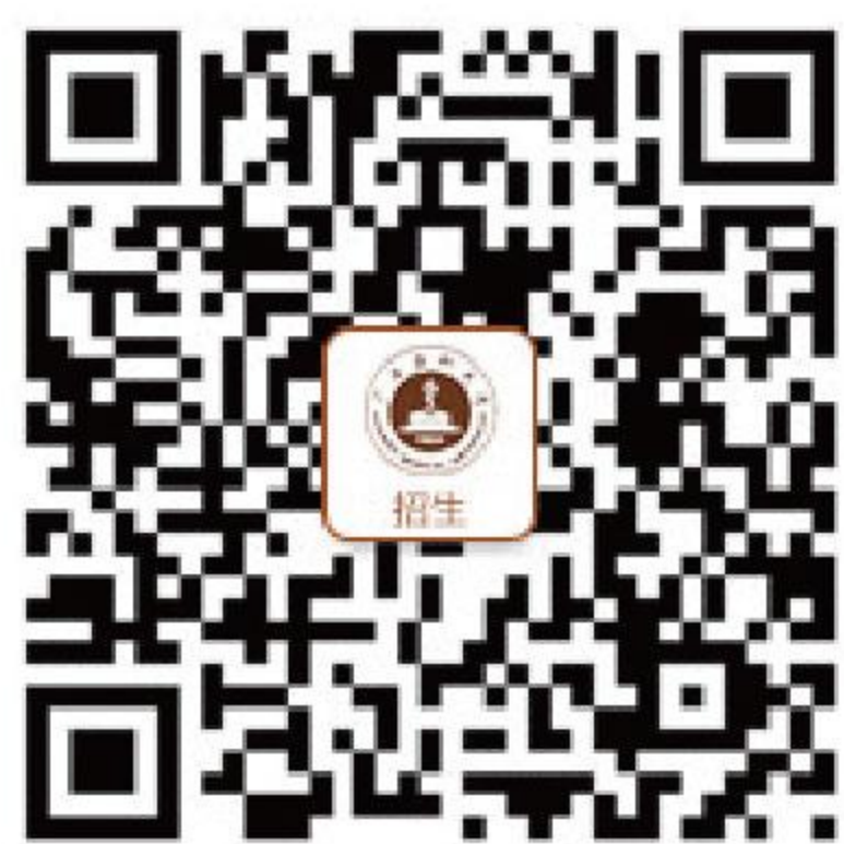
招生就业微信公众号