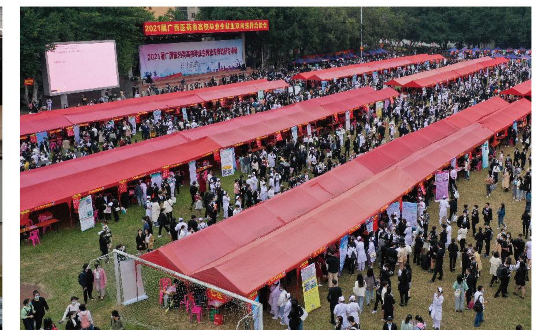
我校举办2021届广西医药类双选会