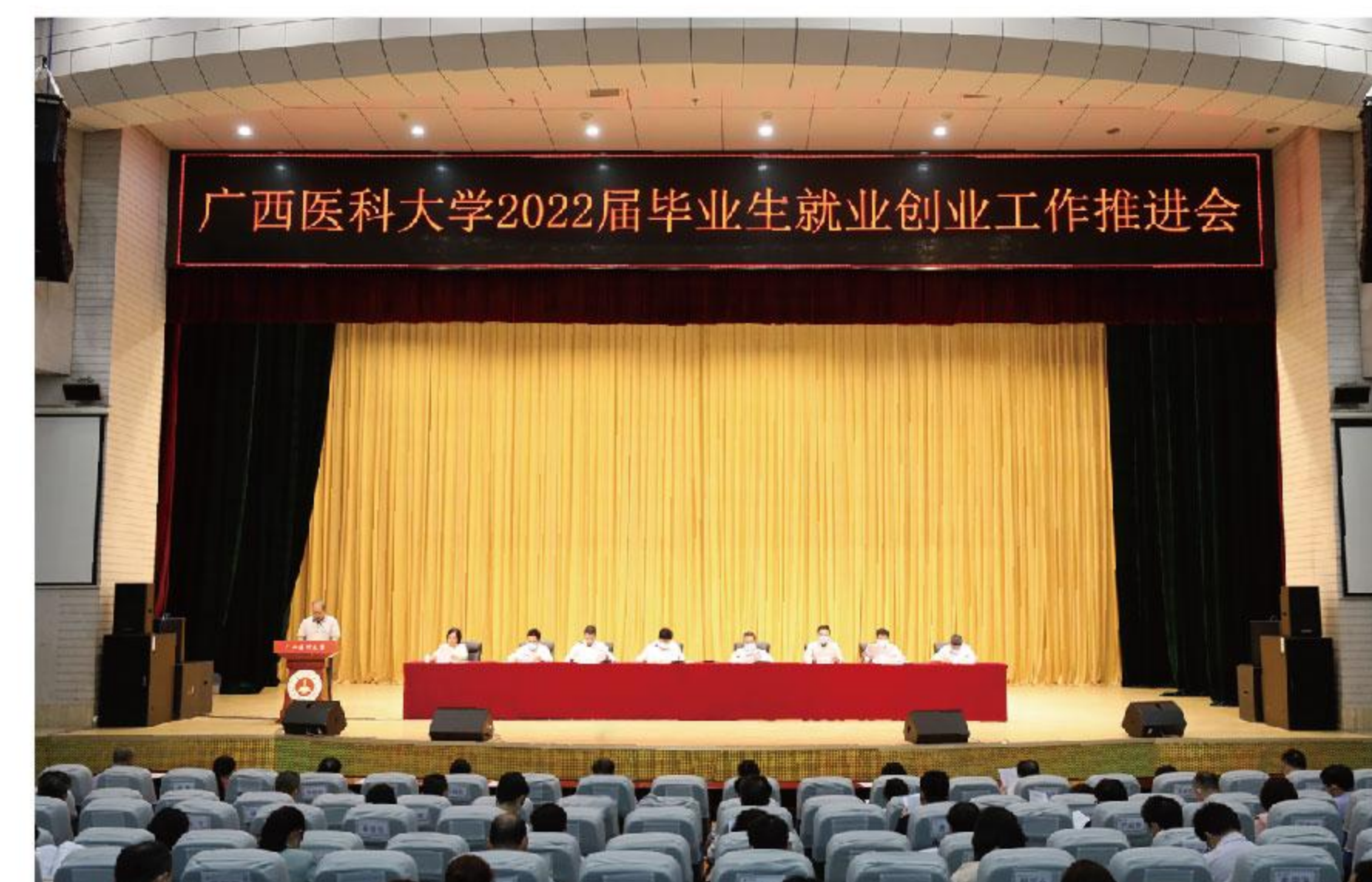
全体校领导出席2022届毕业生就业创业工作