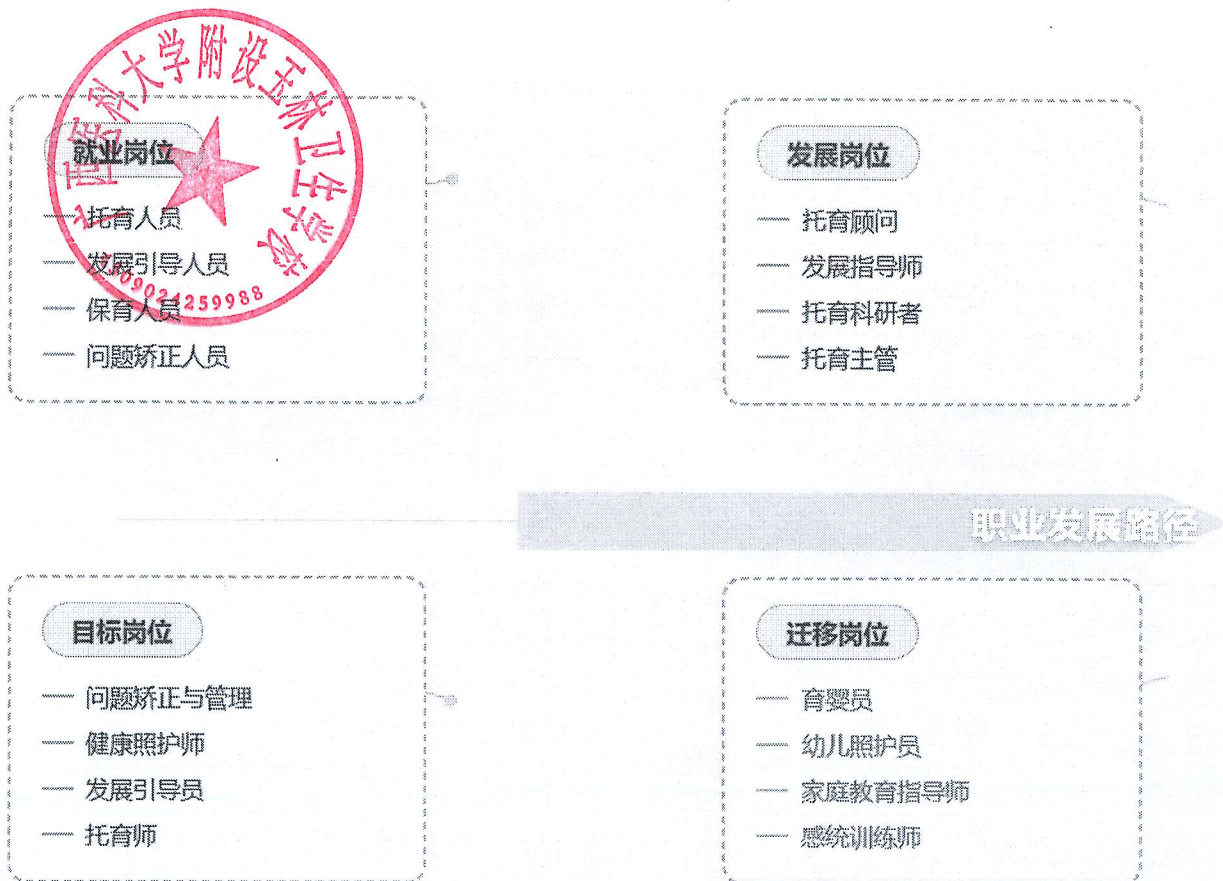
图 婴幼儿托育专业学生主要职业发展路径