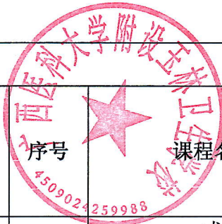
老年人服务与管理专业课程设置与教学计划安排表