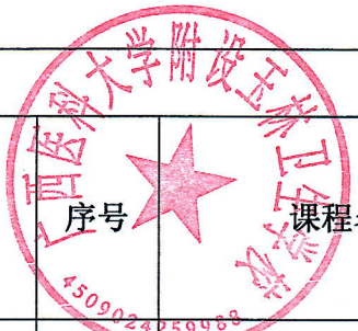
老年人服务与管理专业课程设置与教学计划安排表