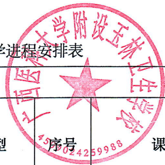
老年人服务与管理专业课程设置与教学计划安排表